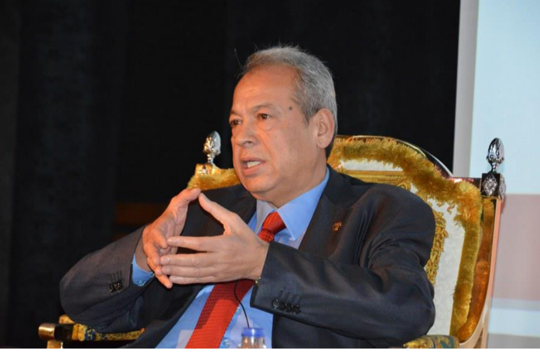
Usta oyuncu Ilyas İlbey

Ünlü oyuncu İlyas İlbey, kendi deneyimlerinden ve yaşamından örneklerle öğrencilere kariyer hayatlarında rehberlik edebilecek önemli bilgiler aktardı.