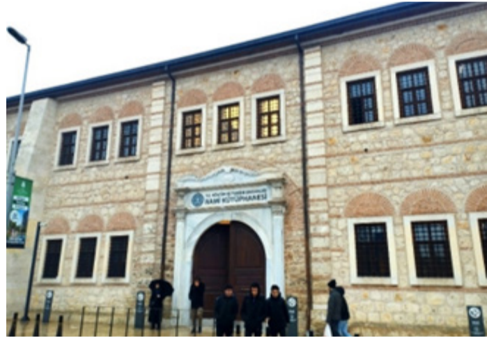
Kütüphanenin "Okuma Salonları" 7 gün 24 saat hizmet veriyor

Açılışının 1.yılıni önümüzdeki günlerde dolduracak olan Rami Kütüphanesi, birçok alanda halka hizmet ediyor. İçerisinde; sergi salonları, bebek ve çocuk kütüphanesi, gençlik kütüphanesi, yetişkin kütüphanesi, dallara göre ayrılan kütüphaneler (Dil Bilimleri, Felsefe- Psikoloji, İlahiyat...) ve daha birçok çalışma alanı barındıran Rami kütüphanesi, kocaman bahçesi ile kapalı alan olduğu kadar açık alanda da, doğa ile iç içe olarak herkese ücretsiz çalışma imkanı sunuyor. Bebekten çocuğa, çocuktan yetişkine birçok vatandaşımıza