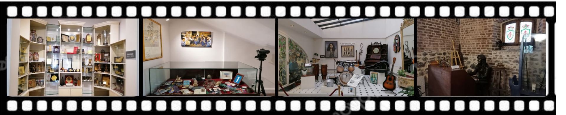
19. yüzyıldan kalma bir köşk olan Barış Manço Evi, onun en sevdiği eşyaları, piyanosu ve kostümleriyle ziyaretçilerine büyümlü bir atmosfer sunuyor

Hepinize “Barış” dolu bir gezi diliyoruz.