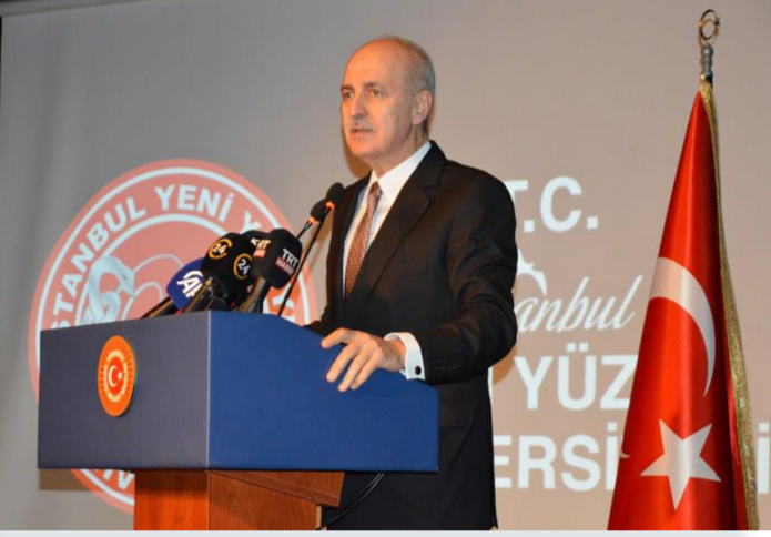
Akademik yılın ilk dersini Prof. Dr. Numan Kurtulmuş verdi

Batının değerlerinin sorgulandığını da söyleyen Kurtulmuş, “75. yılında İnsan Hakları Evrensel Beyannamesinin bir daha asla böyle insan hakları ihlallerine şahit olmayacağı iddiasıyla yazılan beyannamenin artık Avrupa’nın gündeminden düştüğü görülmektedir. Bunu bir iftira olarak söylemiyorum. Birtakım zorla siyonizmin o propaganda mekanizmasının içerisinde nasıl dahil edildiğini biliyorsunuz. Dünyada alenen açıkça biz Filistin’e yapılan zulmün karşındayız diyen futbolcuların, sanatçıların nasıl bir baskı altına tutulduğunu hep beraber izliyoruz. Mesela bir üniversite olduğu için bunları söylemek isterim, modern elektron düşüncenin