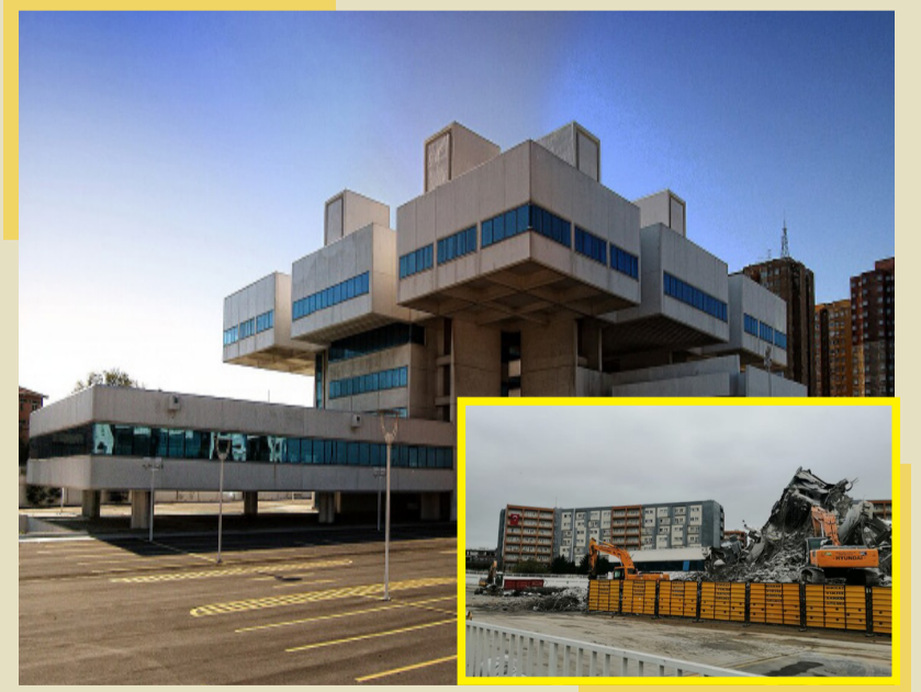
Yıkım sırasında çevrede güvenlik tedbirleri alındı