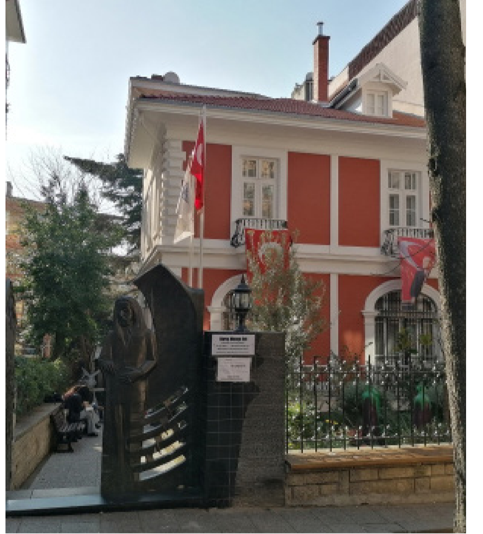
19. yüzyıldan kalma bir köşk olan Barış Manço Evi, onun en sevdiği eşyaları, piyanosu ve kostümleriyle ziyaretçilerine büyümlü bir atmosfer sunuyor

Barış Manço Evi İstanbul'un Kadıköy ilçesinin Moda semtinde bulunmaktadır. Müze “Barış Manço Moda 81300” adını taşımaktadır. Üç kattan oluşan müzenin içinde Barış Manço'nun heykeli, müzik aletleri, özel aksesuarları, konserlerinde giymiş olduğu kıyafetler, ödülleri, kendi özel alanları ve çocuklarının odası bulunmaktadır. Müze, Pazartesi ve resmî tatil günleri hariç her gün saat 09:00-16:00 arası ziyarete açıktır.