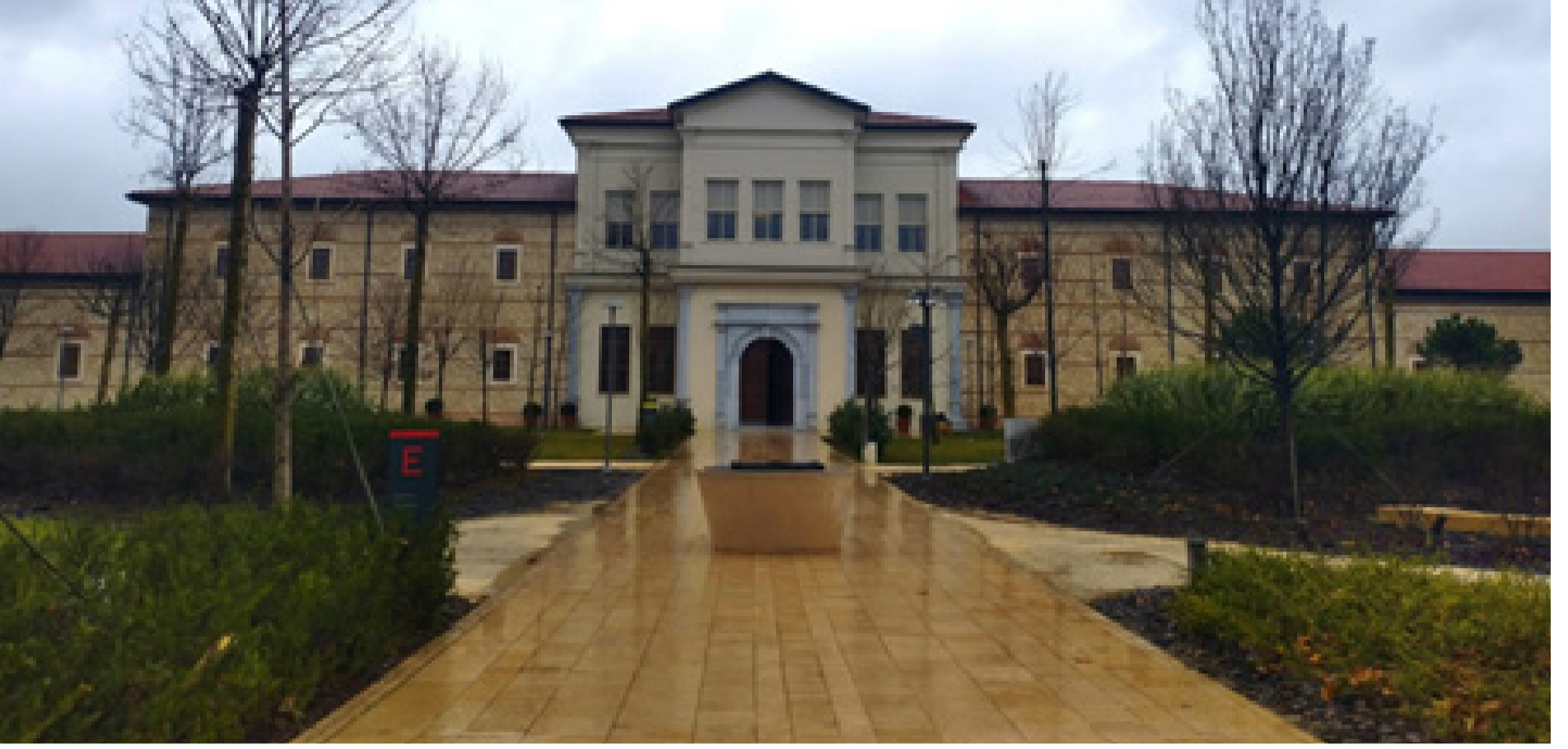
Rami Kütüphanesi yeni yüzüyle öğrencilere hizmet ediyor